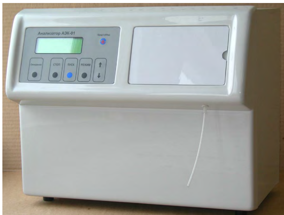
Рисунок 1. Внешний вид анализатора.

Принцип работы анализатора основан на ионоселективном методе измерения. Конструктивно анализатор представляет собой настольную переносную конструкцию. Анализатор выполнен в виде металлического корпуса, внутри которого расположен электронный блок. На передней стенке корпуса крепится панель управления, насосы и электроды. На панели управления прибора расположены: дисплей, предназначенный для вывода информации об измерениях и режимах работы анализатора; кнопка выбора режима работы анализатора («Режим»); кнопка включения отбора пробы («Отбор») и кнопка включения промывки («Промыв»). На задней стенке корпуса прибора расположены выключатель сети и два предохранителя.