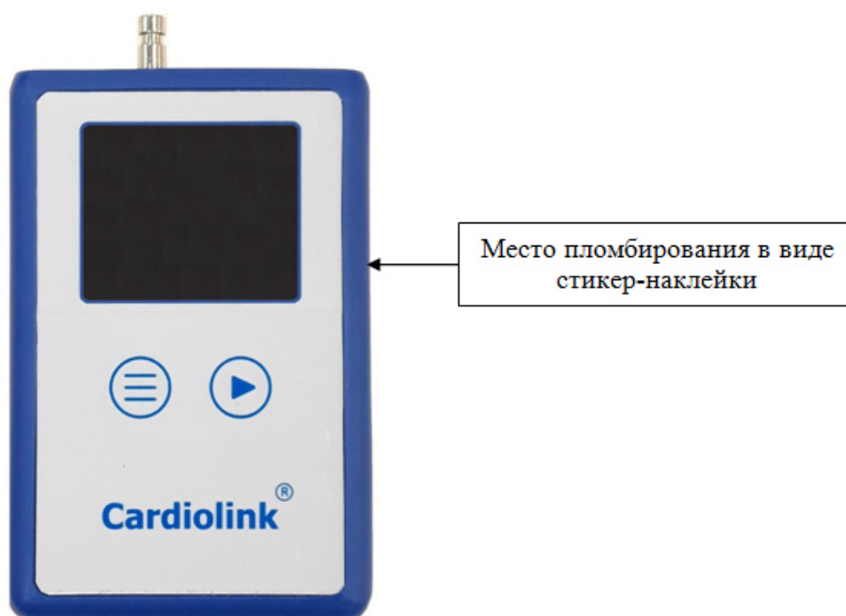
Рисунок 3 – Общий вид мониторов модификации МД-01В2