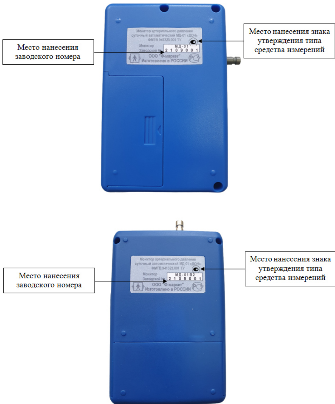
Рисунок 1 – Общий вид средства измерений с указанием мест нанесения знака утверждения типа и заводского номера

Общий вид мониторов двух модификаций, с указанием места пломбировки от несанкционированного доступа представлен на рисунках 2, 3.